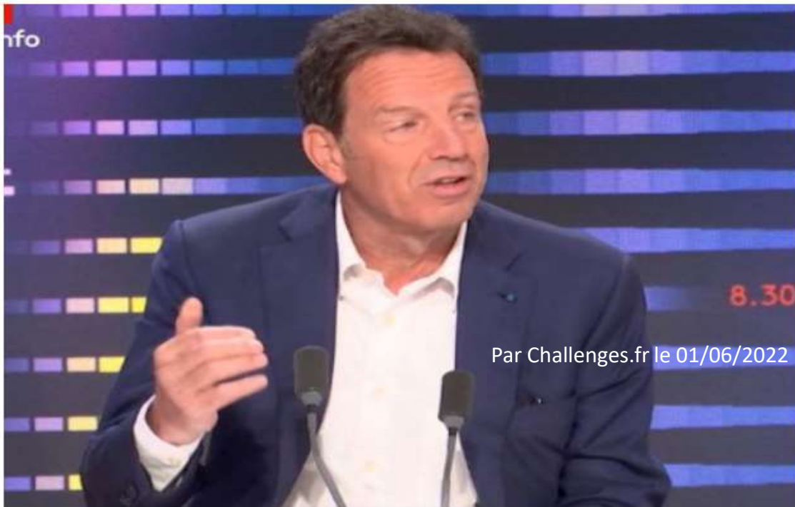
GEOFFROY ROUX DE BÉZIEUX, PRÉSIDENT DU MÉDEF AU MICRO DE FRANCE INFO LE 1ER JUIN 2022.

Le patron du Medef, invité de France Info, reconnaît avec réalisme que les entreprises vont devoir faire un geste sur les salaires.